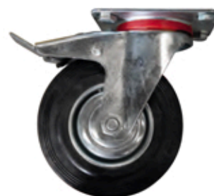
Roues sur jante acier