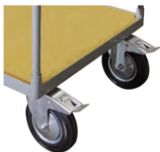
2 roues pivotantes avec frein