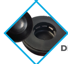
SYSTÈME DE BLOCAGE DE ROUE RENFORCÉ