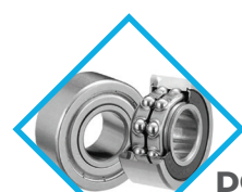
ROULEMENTS À BILLES DOUBLE ÉTANCHÉITÉ