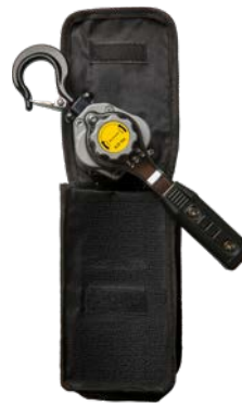
250kg - 500kg